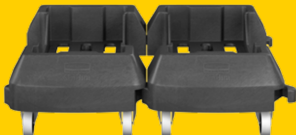
Socle clipsable en résine