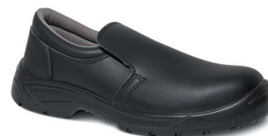
■ 9894 NOIR