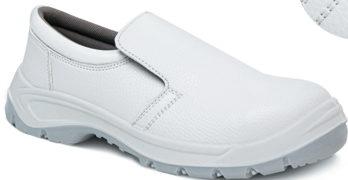
☐ 9897 BLANC | POINTURE : 36 AU 47