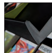
Rebord de tablette : 4 cm