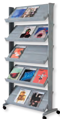
255N.35 teinte alu