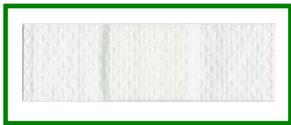
6 cm x 2 cm