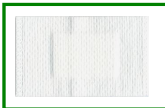
6 cm x 4 cm