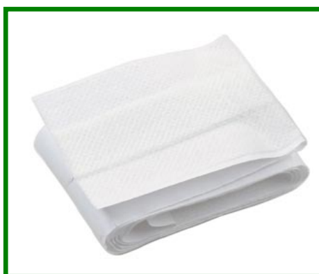
1 m x 6 cm à découper

Descriptif : Pansements adhésifs en non tissé blanc de haute tolérance cutanée Hypoallergéniques Micro aérés et extensibles Compresse non adhérente à la plaie