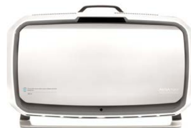
avec pied de sol