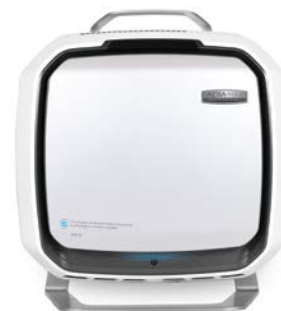
avec pied de sol