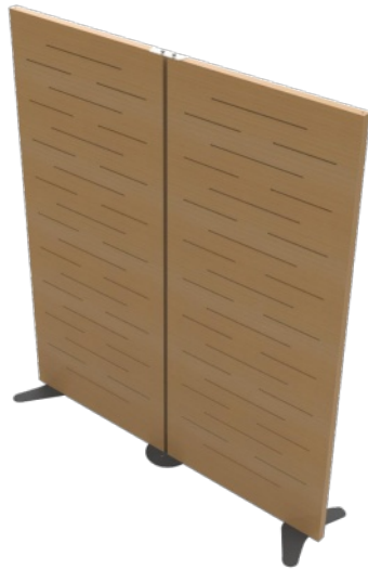
Jonction de 2 cloisons