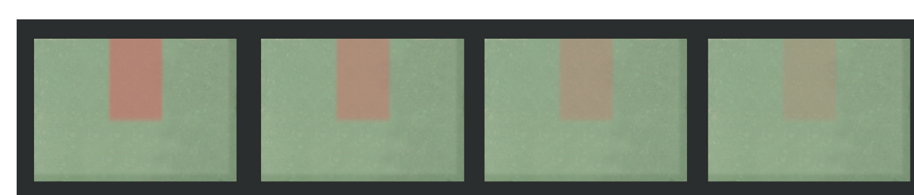
Aspects possibles de l'indicateur

Si aucune barre d'indication n'est apparue au bout de 30 jours d'utilisation, l'indicateur ne doit pas être utilisé comme méthode principale de remplacement des filtres.