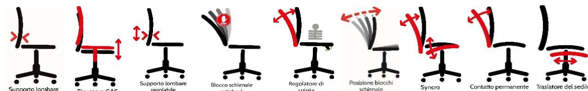
le immagini sono rappresentative dei movimenti delle sedute

Elevazione a gas; - supporto lombare regolabile ; - Meccanismo synchro tra sedile e schienale, a contatto permanente schienale con ritorno controllato da con 4 blocchi antishock; - Sedile dotato di traslatore (avanti e indietro)