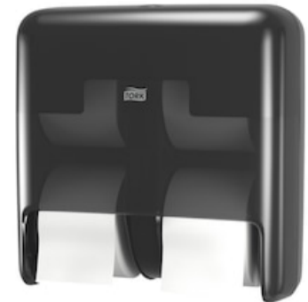
Tork OptiServe Coreless 4-Roll Dis Black 558052