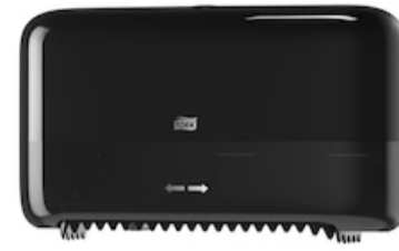
Tork T7 Disp Mid-Size coreless nero 558048