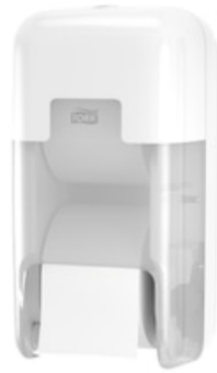
Trk OptiServe Coreless 2-Roll Dis Whi v 558041