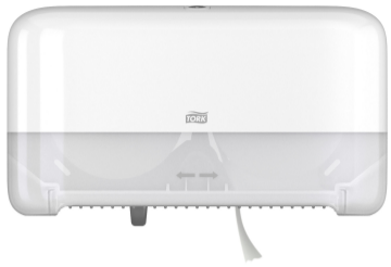
Tork T7 Disp Mid-Size coreless bianco 558040