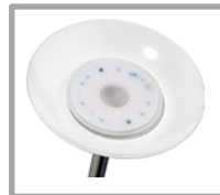
Particolare del led