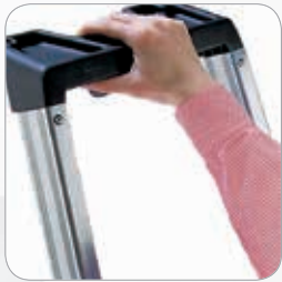
Vaschetta porta oggetti anatomica di sicura presa