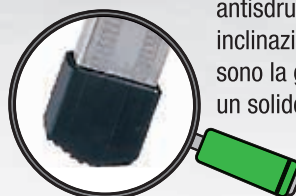
Alti calzari in gomma antisdrucchiolo ad inclinazione variata sono la garanzia per un solido appoggio.