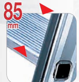
85 mm Gradini profondi 85 mm