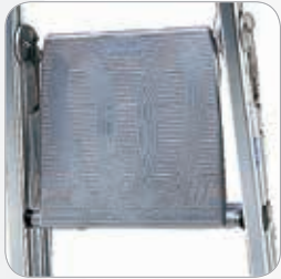
Elegante pedana di calpestio in solido alluminio fuso