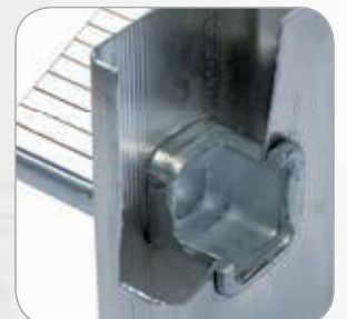
Energico doppio bloccaggio idraulico senza rivetti