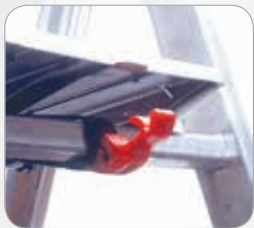
SISTEMA SICUREZZA: gancio di blocco pedana