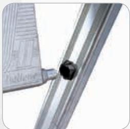
Bronzina in nylon dove ruota la pedana