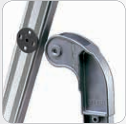
Cerniera in alluminio fuso con interposte frizioni bilaterali