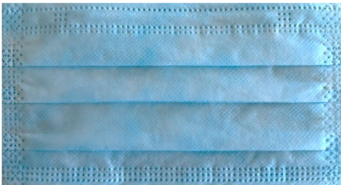
Figura 2 – Foto