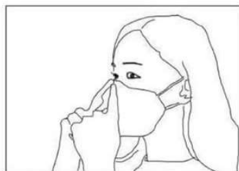
Agganciare gli elastici dietro alle orecchie. Conformare lo stringinaso facendolo aderire ai contorni