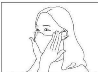
Premere leggermente per ottenere la migliore aderenza possibile anche sulle guance e sotto il mento

Rimuovere la mascherina evitando il contatto con la parte interna.