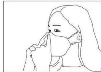
Agganciare gli elastici dietro alle orecchie. Conformare lo stringinaso facendolo aderire ai contorni