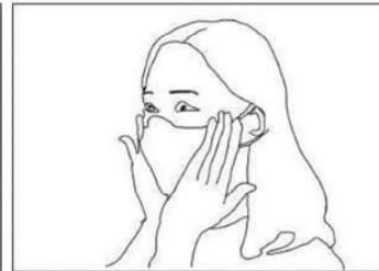
Premere leggermente per ottenere la migliore aderenza possibile anche sulle guance e sotto il mento

Rimuovere la mascherina evitando il contatto con la parte interna.