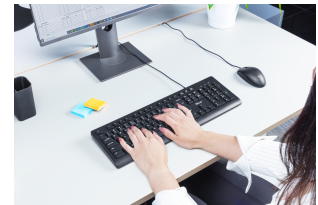
LIFESTYLE VISUAL 1