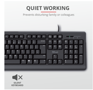
PRODUCT PICTORIAL 2