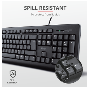
PRODUCT PICTORIAL 3