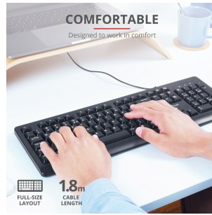
PRODUCT PICTORIAL 1