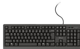
PRODUCT TOP 1