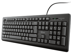
PRODUCT VISUAL 1