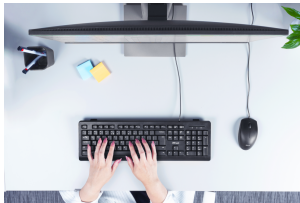
LIFESTYLE VISUAL 2