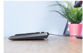
LIFESTYLE VISUAL 4