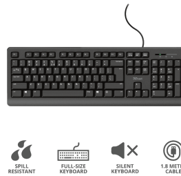
PRODUCT ESHOT 1