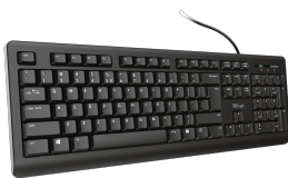
PRODUCT VISUAL 2