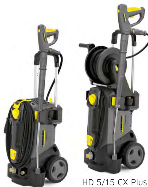
HD 5/15 CX Plus