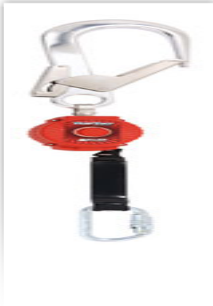
PRODUCT NUMBER: 1018014 TURBOLITE webbing 2m webbing 2m - Scaf hook + Twistlock