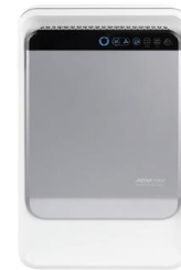
Muurbevestiging met stekker