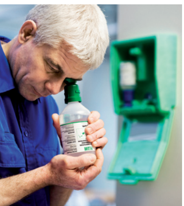
W przypadku urazów mechanicznych przy płukaniu można pochylić się do przodu.