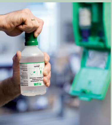
Przekręcić kośćcówkę, aż złamie się zabezpieczenie.