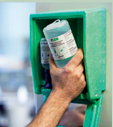
Butelkę należy wyjąć z uchwytu w pozycji pionowej.