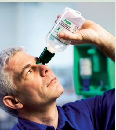
Odchylić głowę do tyłu, przyłożyć kośćcówkę do oka i płukać.