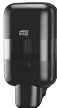
Tork Mini Soap&Sanitizer Disp.Bl 565208