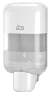
Tork Mini Soap&Sanitizer Disp.Wh 565200