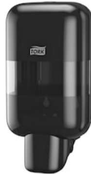
Tork Mini Soap&Sanitizer Disp.BI 565208