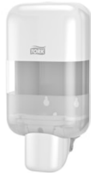
Tork Mini Soap&Sanitizer Disp.Wh 565200