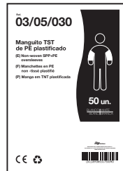
EXEMPLO DE APRESENTAÇÃO

MATERIAL DO Saco: 100% polietileno virgem (0% reciclado) PESO: 4,55 gr *