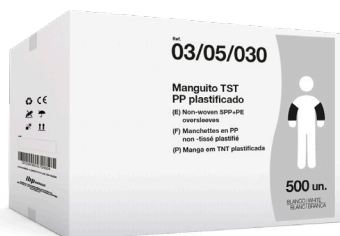
EXEMPLO DE APRESENTAÇÃO