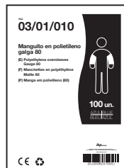
EXEMPLO DE APRESENTAÇÃO