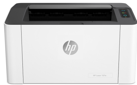
HP Laser 107w

Impressora com segurança dinâmica ativada. Destina-se apenas a ser utilizada com consumíveis que utilizam um chip HP original. Os consumíveis com um chip de outra marca poderão não funcionar e aqueles que funcionam atualmente poderão não funcionar no futuro. Saiba mais em: http://www.hp.com/go/learnaboutsupplies