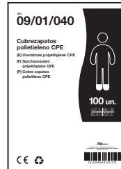
EJEMPLO DE PRESENTACIÓN