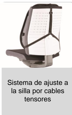
Sistema de ajuste a la silla por cables tensores