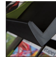
Borde de 4 cm