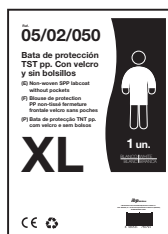
EJEMPLO DE PRESENTACIÓN