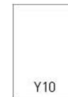
Y10 - 140x204 mm