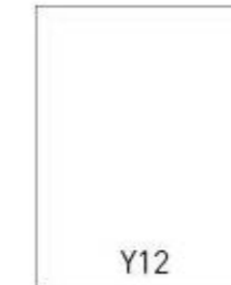
Y12 - 210x270 mm