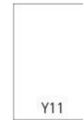
Y11 - 165x240 mm