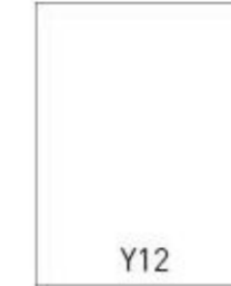
Y12 - 210x270 mm