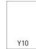
Y10 - 140x204 mm