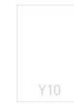
Y10 - 140x204 mm