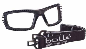
Espuma y cinta