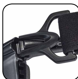
Sistema de fijación