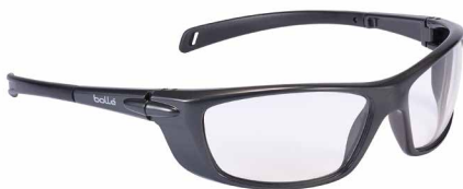
Gafas sin espuma