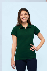
PERFECT WOMEN 11347