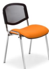
ISO ERGO MESH