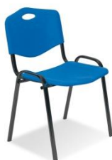
ISO PLASTIC BLACK