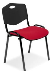
ISO MIX BLACK