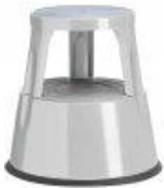
Color: 6300-9 RAL 7035