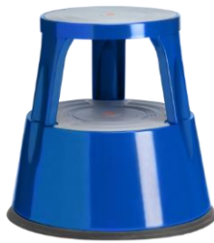
Color: 6300-5 RAL 5005