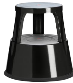
Color: 6300-1 RAL 9005