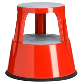
Color: 6300-4 RAL 3020