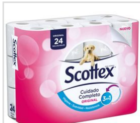
View: 3D Model