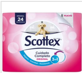
View: Flat Front_2D