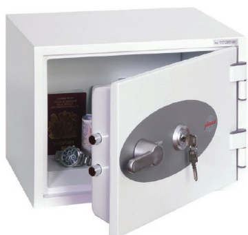
Titan II FS1271K