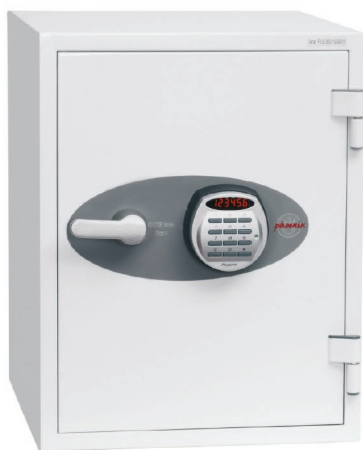
Titan II FS1273E