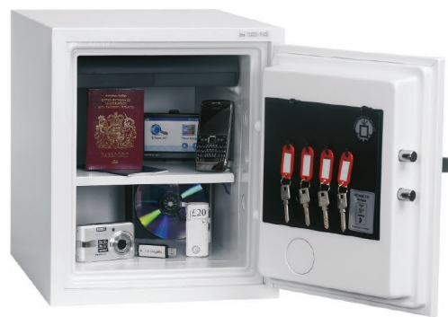
Titan II FS1272K/E/F