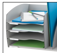
puerta-etiquetas y etiquetas incluidas