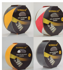
CINTA ANTIDESLIZANTE ADHESIVA