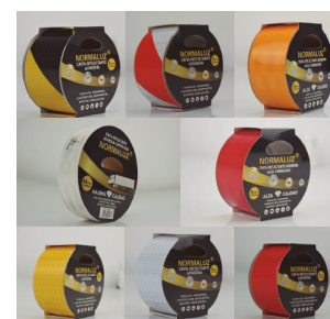
CINTA ADHESIVA REFLECTANTE DIFERENTES MEDIDAS Y COLORES