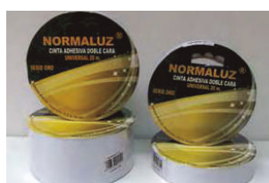
CINTA ADHESIVA DOBLE CARA SERIE ORO