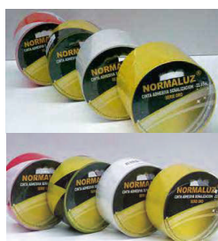
CINTA ADHESIVA SEÑALIZACIÓN SERIE ORO

El reverso esta cubierto con un adhesivo sensible a la presión, cubierto por papel protector removible.