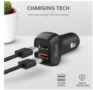
PRODUCT PICTORIAL 2