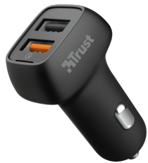
PRODUCT VISUAL 2