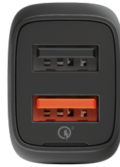
PRODUCT FRONT 1