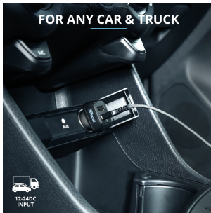
PRODUCT PICTORIAL 3