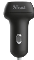
PRODUCT TOP 1