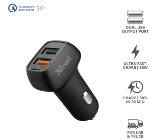
PRODUCT ESHOT 1