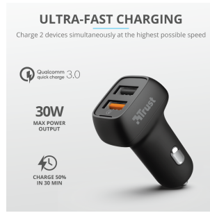
PRODUCT PICTORIAL 1