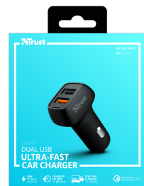
PACKAGE FRONT 1