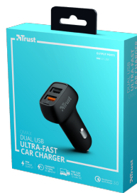
PACKAGE VISUAL 1